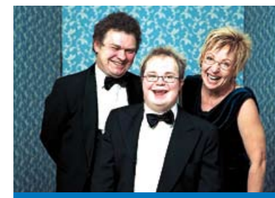
Fotoprojekt „Ballkönige“, ein Geschenk von Florian von Ploetz, fotografiert 2008 beim Ball der Lebenshilfe.