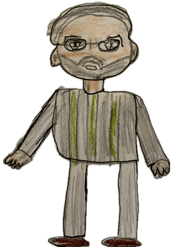
KLASSENLEHRER VON ALEX